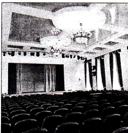
Обновленный актовый зал.

Ивановский энергоуниверситет полностью готов к учебному году и скоро гостеприимно распахнет двери для первокурсников, которым предстоит влиться в дружную семью энергетов.