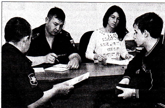
Средний конкурс – более двух человек на место.

В этом году также возобновлен прием абитуриентов в единственный в регионе учебный военный центр (УВЦ). Одновременно получить и гражданскую, и военную специальность решили 56 ребят. Продолжает готовить специалистов для Вооруженных сил России военная кафедра.