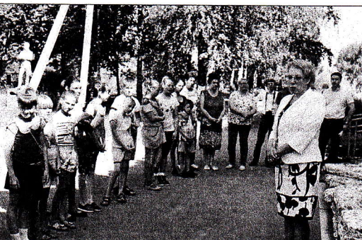
За школьные парты в этом году сядет 91 первоклассник.

Организация летнего отдыха, питания обучающихся 1–4 классов в детей из семей, находящихся в трудной жизненной ситуации,